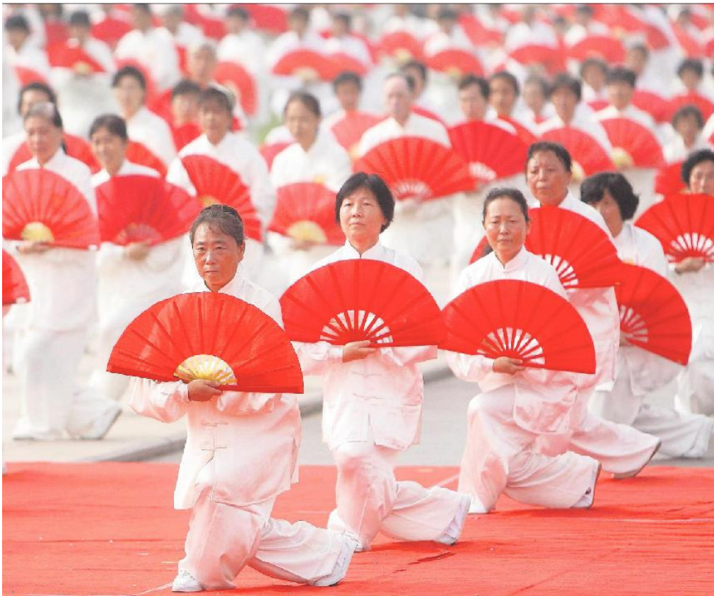
Fire udviklingsmarkeder, Brasilien, Rusland, Indien og Kina (BRIK), står på spring til at sætte sig på en markant større del af den globale vækst og økonomi. EU sætter primært sin lid til den fælles frihandelsrunde Doha i WTO-regi, mens USA har fuld fart på de bilaterale aftaler med især Asien. Den kurs vil EU også søge nu for ikke at blive viftet af banen i kampen om bl.a. det lukrative kinesiske marked.