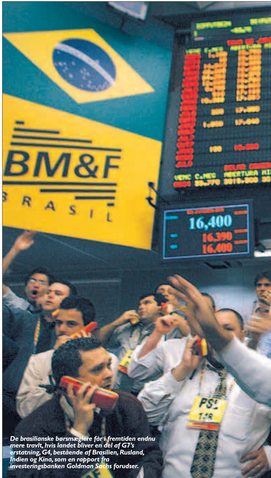
De brasilianske børsrådgivere får i fremtiden endnu mere travlt, hvis landet bliver en del af G7's erstatning, G4, bestående af Brasilien, Rusland, Indien og Kina, som en rapport fra investeringsbanken Goldman Sachs forudser.

Han var noget nær æresgæst under World Economic Forum i Davos i januar 2003, og i september tog han opmærksomheden under WTO-forhandlingerne i Cancún som fortaler for tredjeverdenlandenes utilfredshed med manglende amerikanske og europæiske indrømmelser på handelsområdet, herunder landbrugsstøtten. På Davos-topmødet var Lula