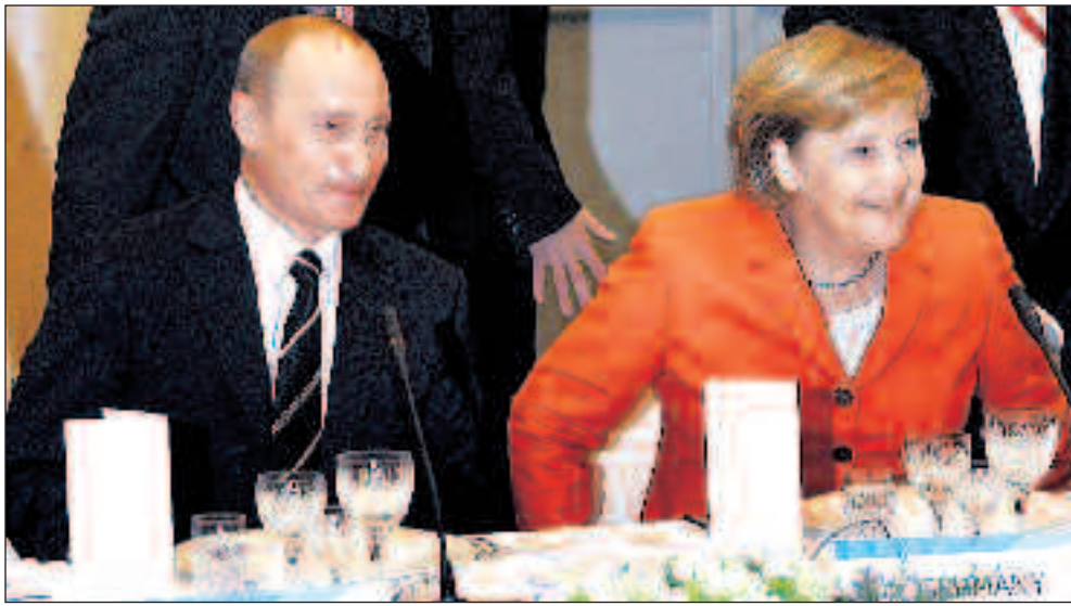
EU-topmødet i fredags i Lahti i Finland havde fokus på energisamarbejdet, hvor især Tyskland og kansler Angela Merkel spiller en hovedrolle. Ruslands præsident Vladimir Putin var gæst under topmødet.

Fedme fører i mange tilfælde til hjerteproblemer, astma, brystkræft, kræft i tyktarmen og diabetes, og sådanne følgesygdomme koster det amerikanske samfund store beløb og har samtidig alvorlige sociale konsekvenser.