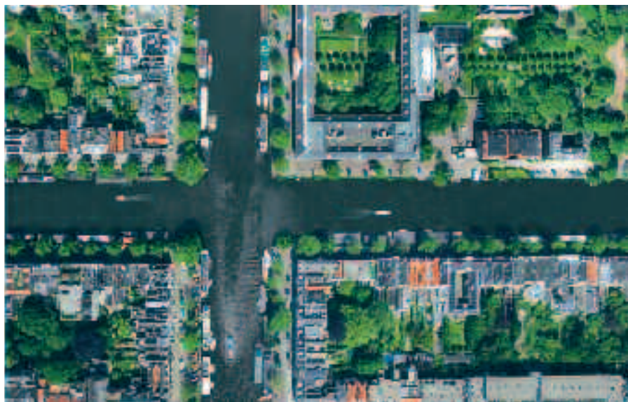
BERLIN BUKAREST DUBLIN ISTANBUL LONDON MADRID MILANO MOSKVA MÜNCHEN PARIS PRAG TALLIN WARSZAWA ZAGREB

Danmarks Eksportråd er repræsenteret 90 steder verden over. Vi er dér, når du vil i gang - eller videre. Vi har lokalkendskab og adgang til beslutningstagere på alle niveauer. Vi hjælper dig med at analysere dine forretningsmuligheder, forbedre din konkurrenceevne samt øge dit internationale salg. Læs mere på www.eksportraadet.dk